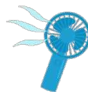
ハンディー扇風機