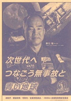
令和6年度危険物安全週間推進ポスター

〒105-0001 東京都港区虎ノ門二丁目9番16号 日本消防会館8階 (一財)全国危険物安全協会内 危険物安全週間推進協議会事務局 TEL 03-5962-8921